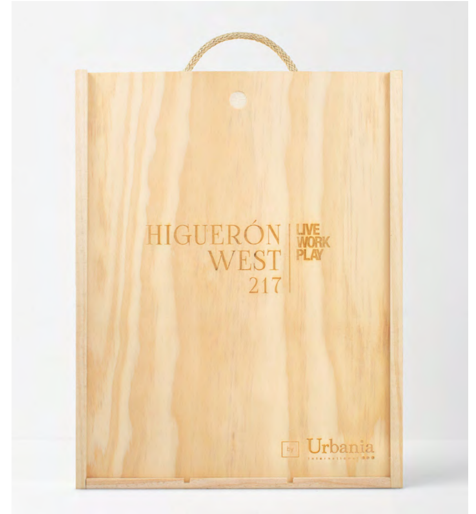
GRABADO LÁSER EN LA TAPA DE LA CAJA