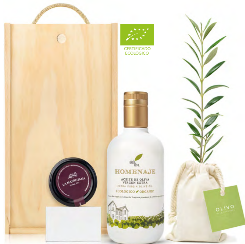
GO304 LOTE GOURMET ECO OLIVE