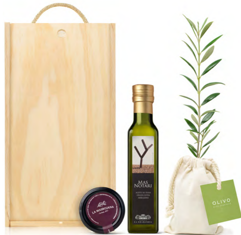
GO229 LOTE GOURMET OLEUM