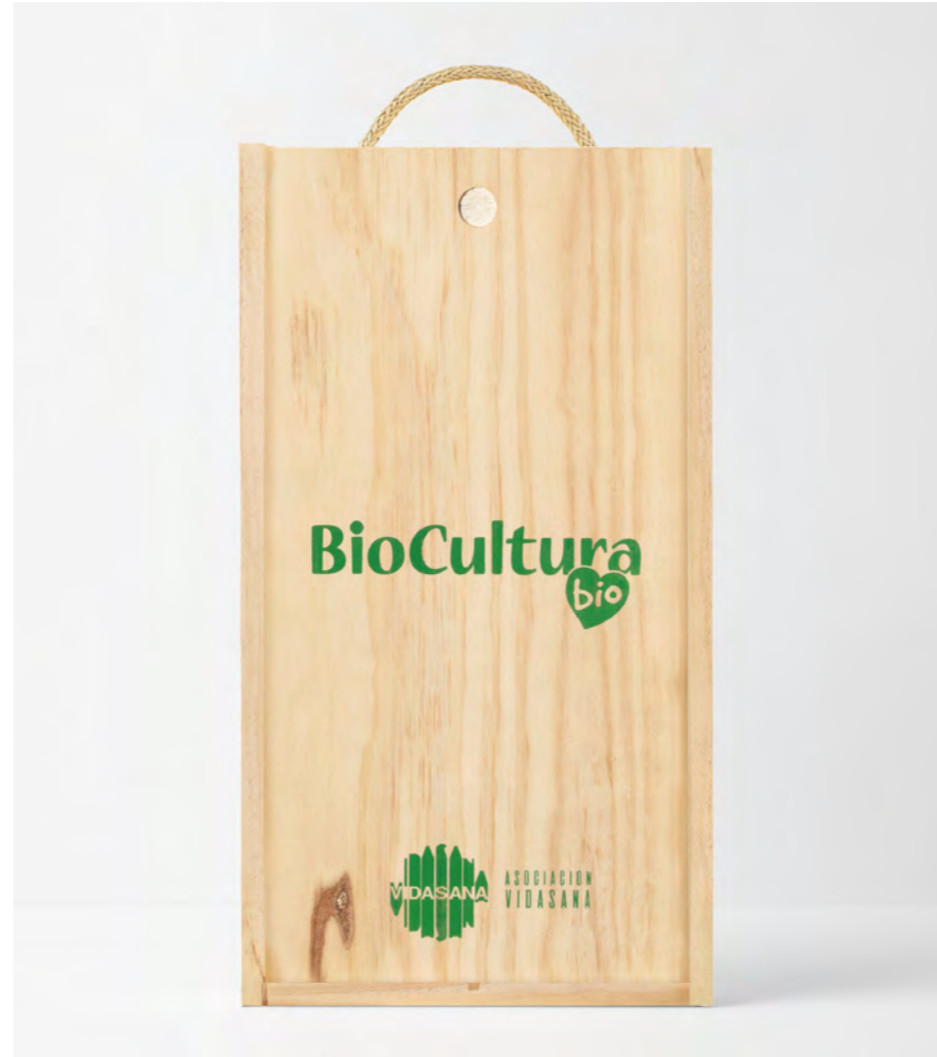
SERIGRAFÍA EN LA TAPA DE LA CAJA