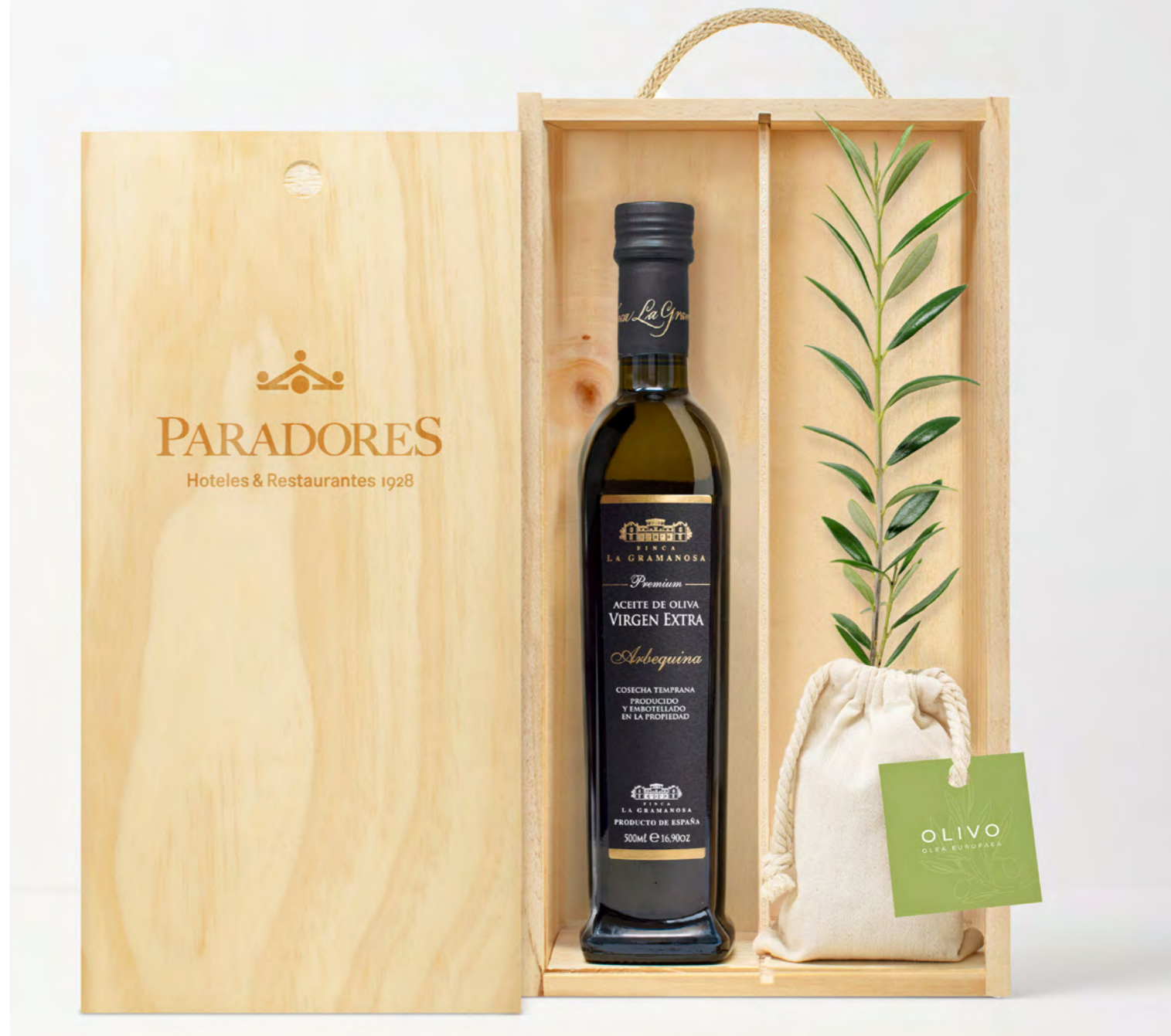
GO228 LOTE GOURMET OLIVIA PREMIUM