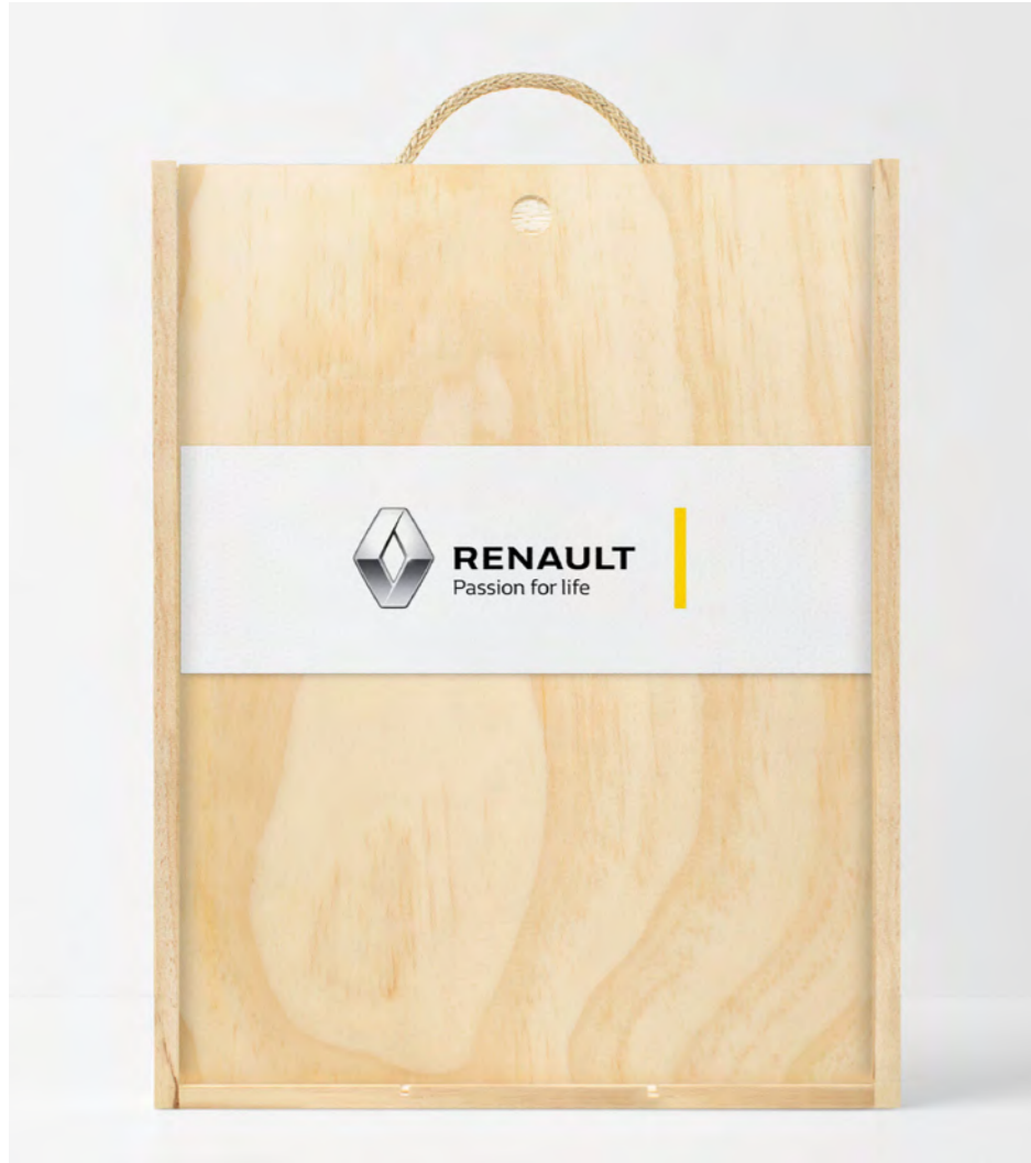
TARJETÓN EN LA TAPA DE LA CAJA