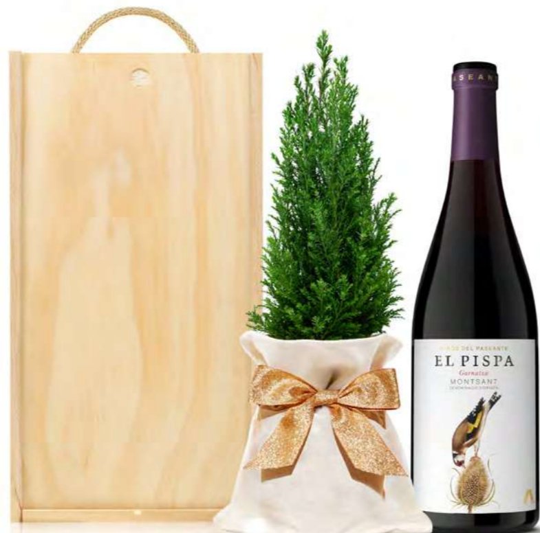
GO395N SET BODEGA NAVIDAD EL PISPA