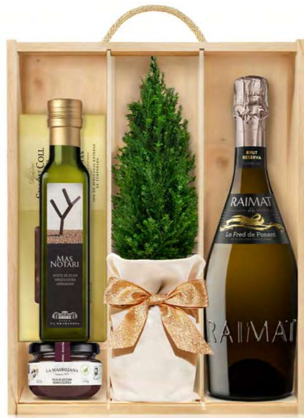
GO355N LOTE GOURMET NAVIDAD SELENE RAIMAT