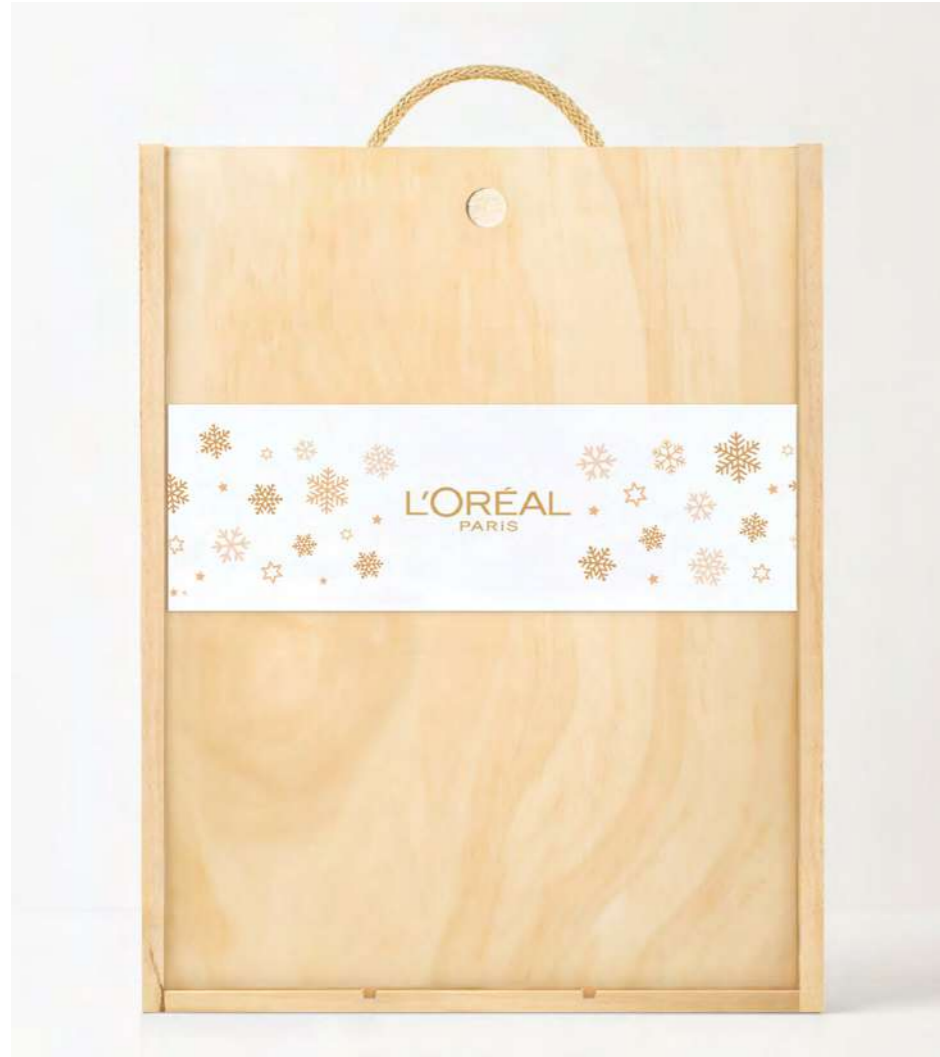
TARJETÓN EN LA TAPA DE LA CAJA