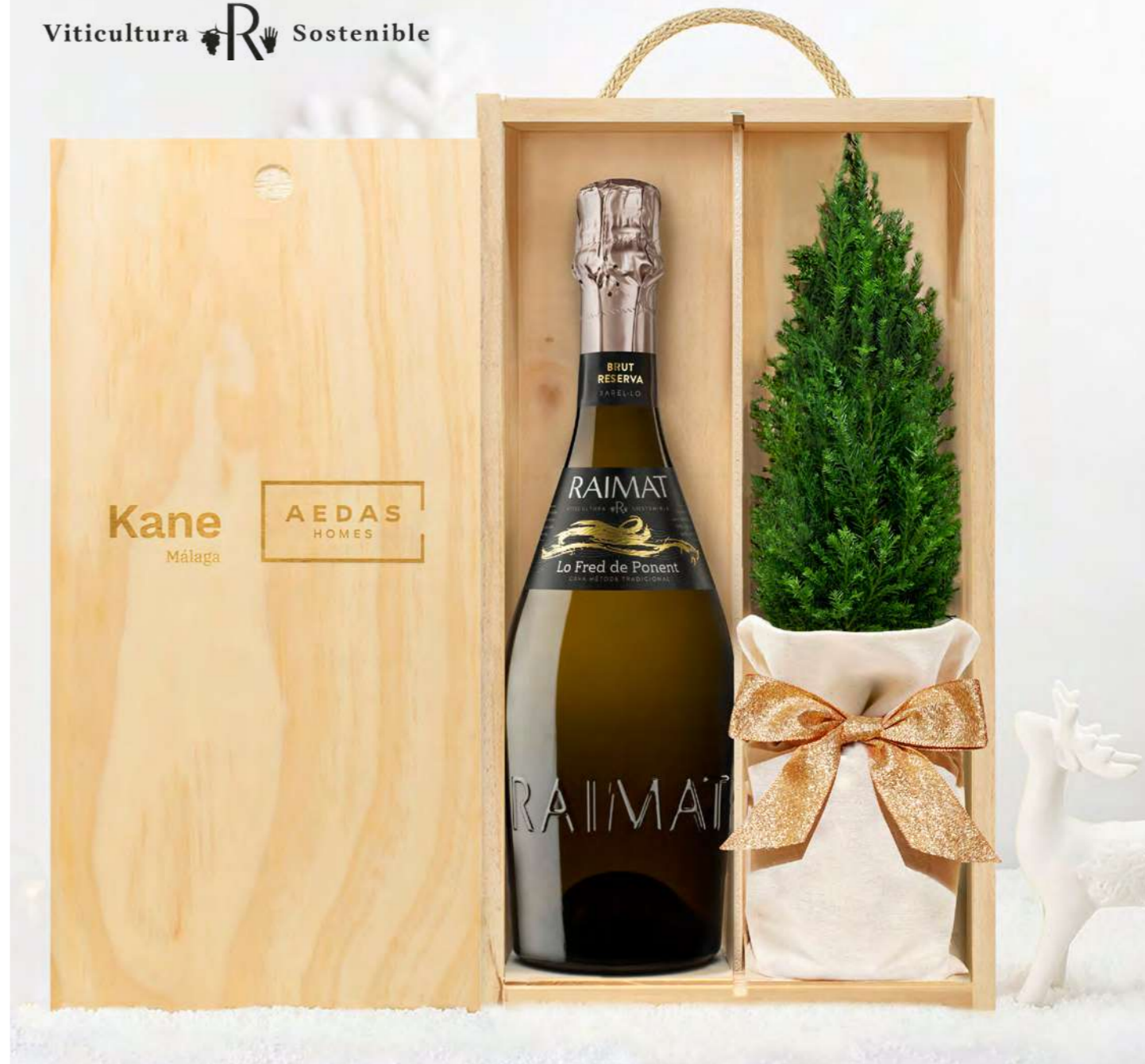
GO265N SET CAVA BRUT RESERVA LO FRED DE PONENT