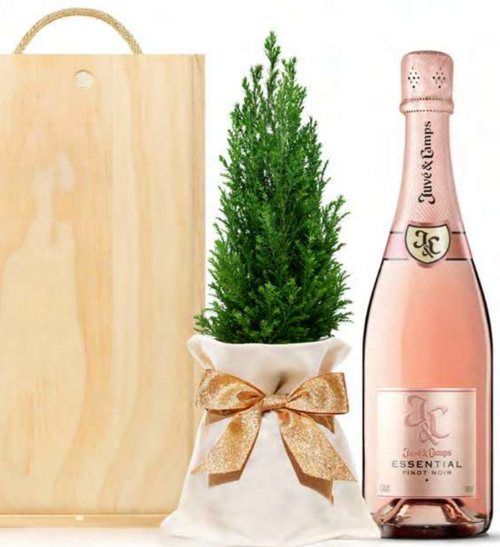
GO396N SET NAVIDAD BODEGA ROSÉ

Cava Juvé & Camps Brut Rosé Pinot Noir . 75 cl.