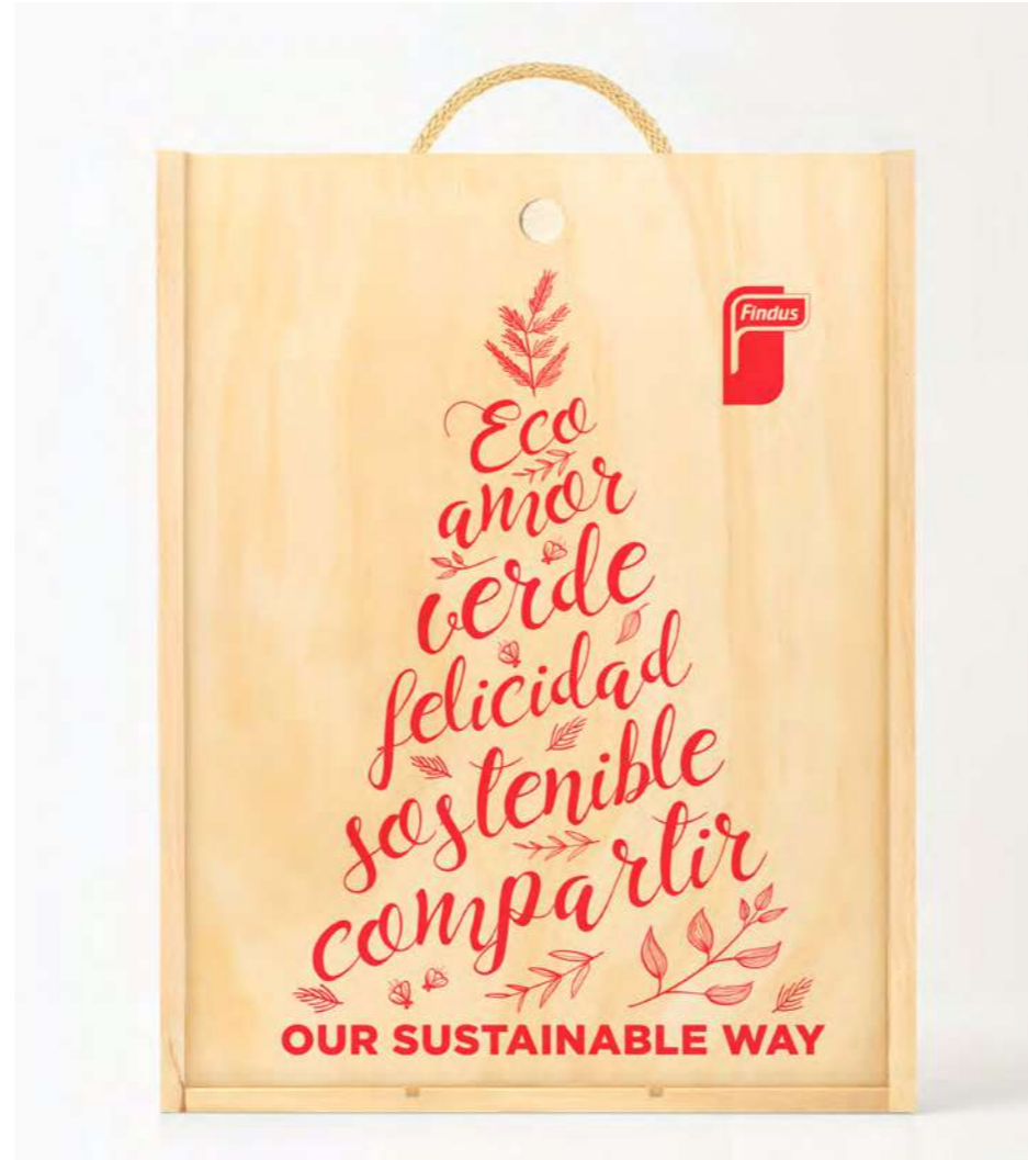
SERIGRAFÍA EN LA TAPA DE LA CAJA