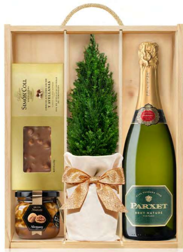
GO402N LOTE GOURMET BURBUJAS NAVIDEÑAS