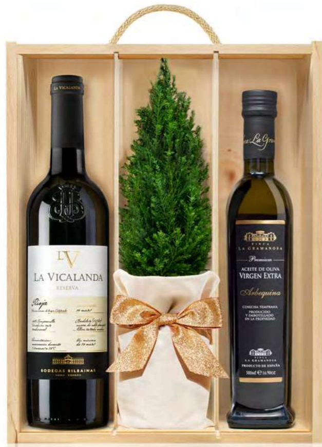
GO236N LOTE GOURMET NAVIDAD DELECTA PREMIUM