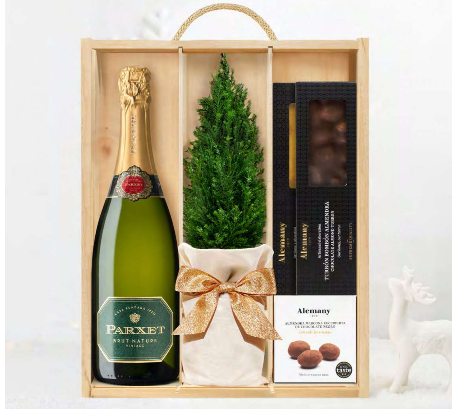
GO290N LOTE GOURMET NAVIDAD SPARKLING