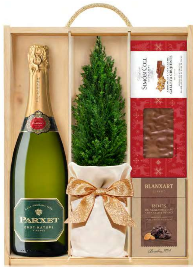
GO422N LOTE GOURMET NAVIDAD DULZURA PARXET