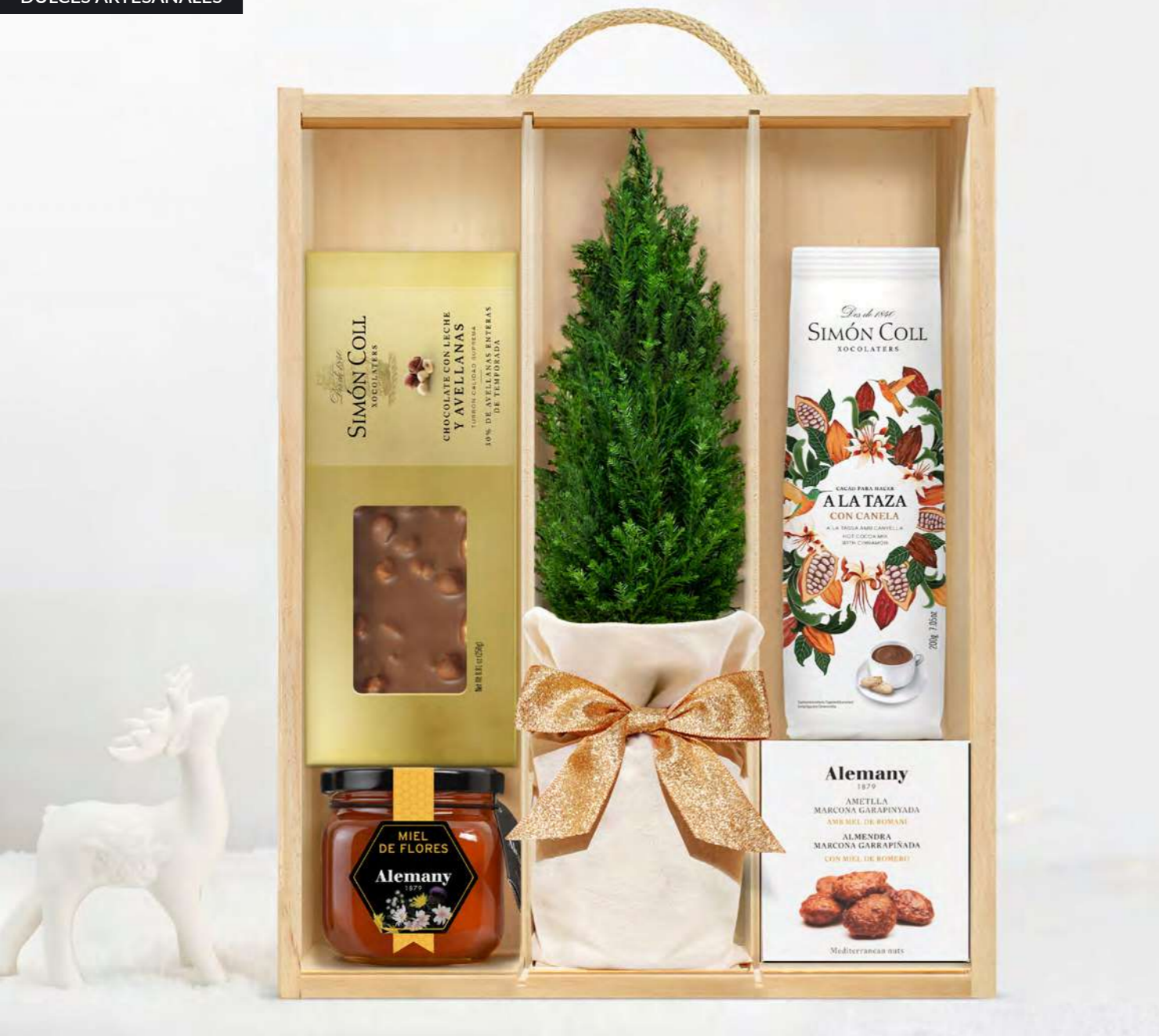
GO400N LOTE GOURMET NOCHE INVERNAL