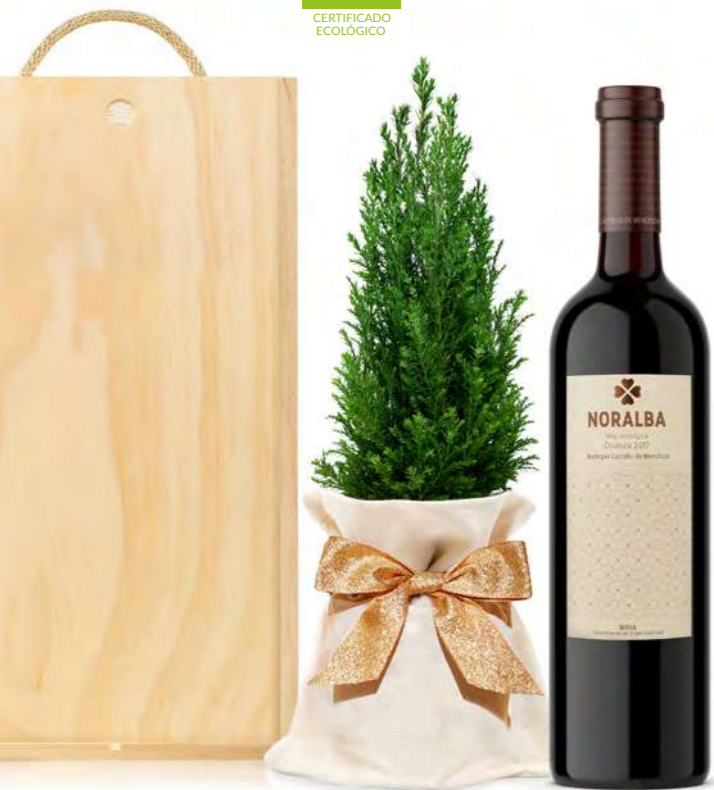
GO118N SET VINUM NAVIDAD NORALBA ECO