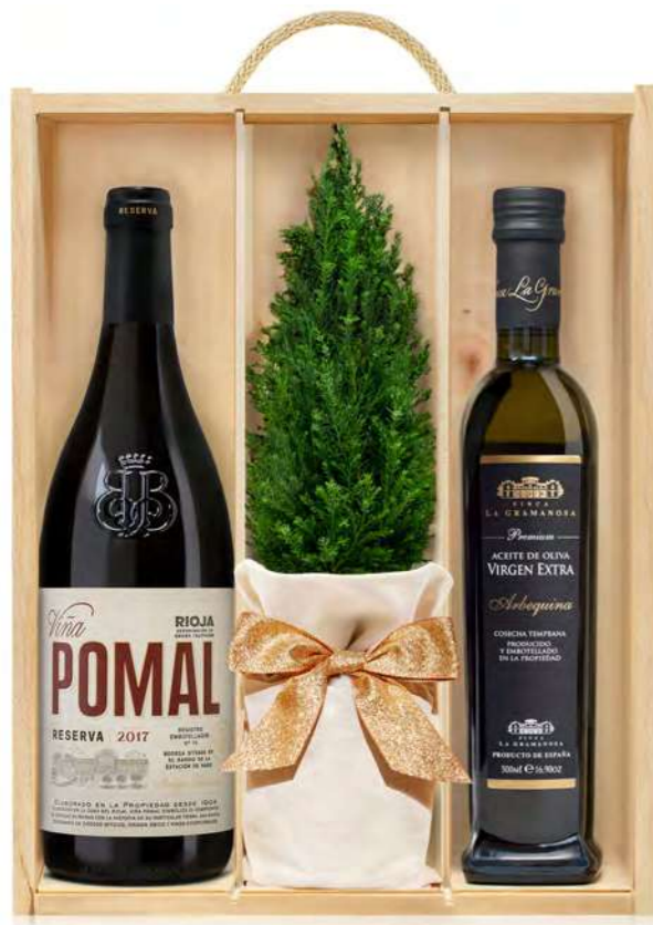
GO235N LOTE GOURMET NAVIDAD DELECTA RESERVA