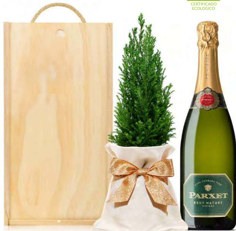
GO264N SET CAVA BRUT RESERVA PARXET

- Cava Parxet Brut Nature Reserva ecológico. 75 cl.