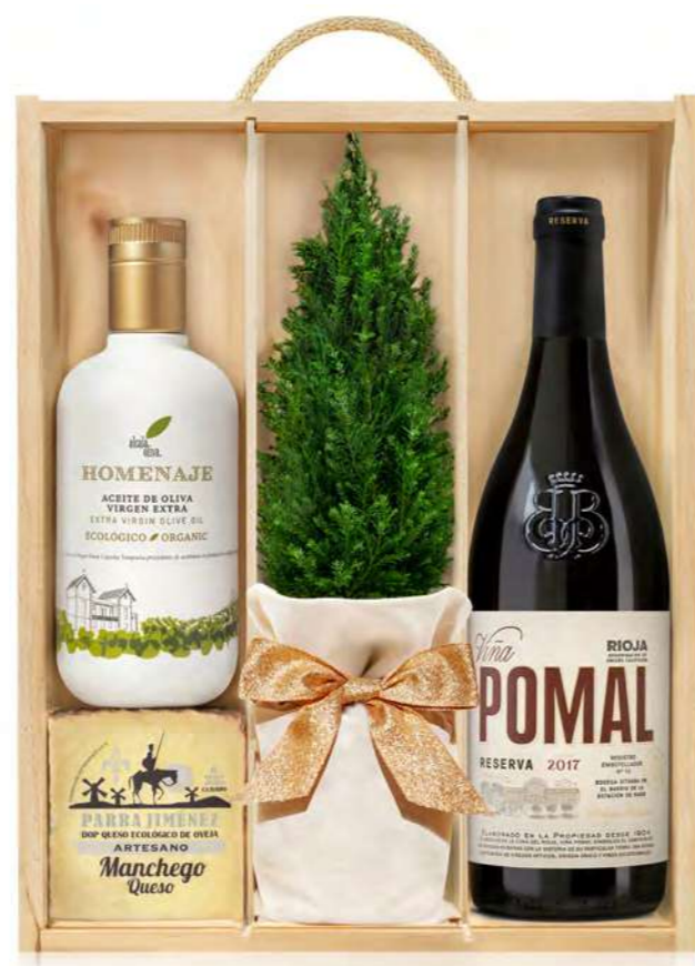
GO390N LOTE GOURMET NAVIDAD CASEUS BODEGA