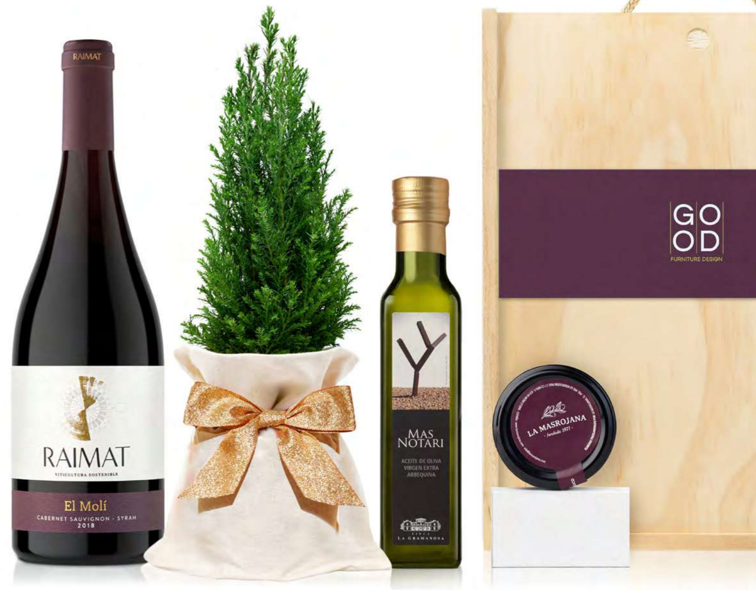
GO237N LOTE GOURMET NAVIDAD HERA RAIMAT