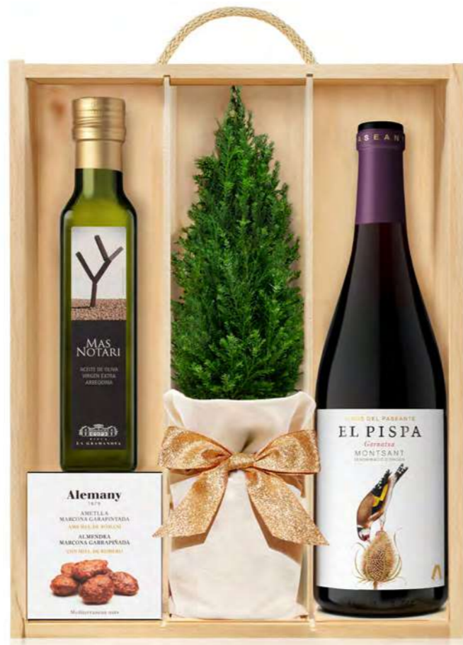
GO387N LOTE GOURMET NAVIDAD EL PASEANTE