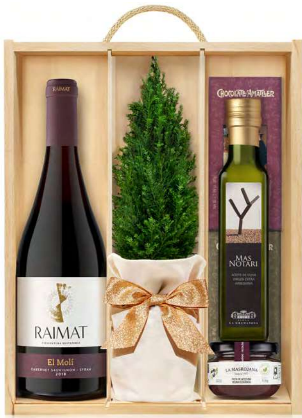
GO333N LOTE GOURMET NAVIDAD PERLE