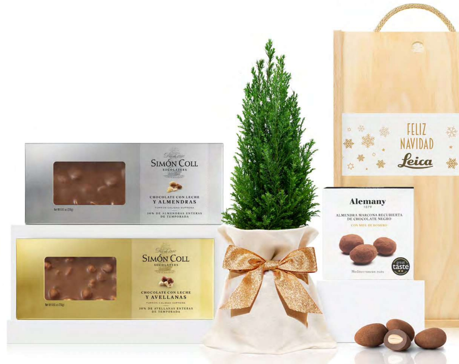
GO399N LOTE GOURMET NAVIDAD COCOA